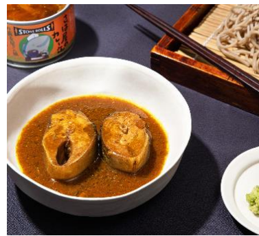
お蕎麦屋さん風さばカレー