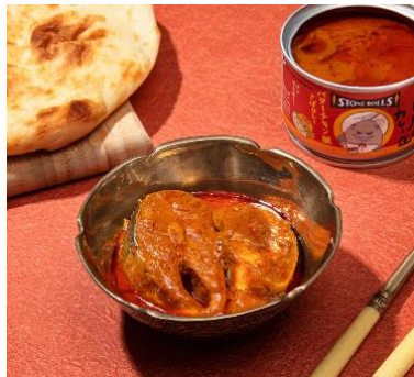
バターチキン風さばカレー