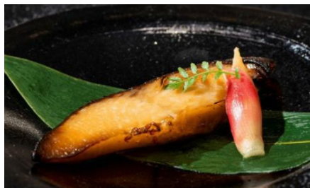
銀だらの西京漬け