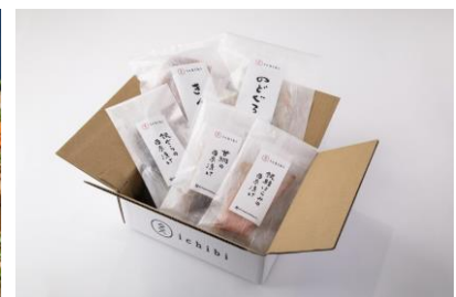
商品お届けイメージ